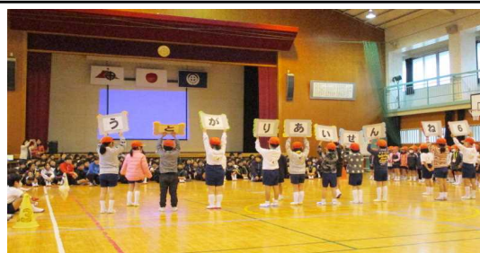
【6年生を送る会 ～6年生ありがとう～】