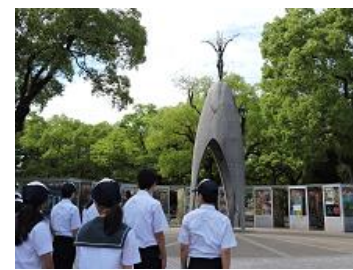
【「祈りの子の像」前で平和祈念集会】