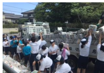
【正門前での積み込みの様子】

5月12日(土)の午後、今年度1回目のPTA資源リサイクル活動を行いました。生徒たちは、学級ごとに決められた集荷場所に集まり、新聞やビン等を回収しました。