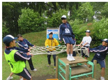
【雨もあがって野外での活動】

集団生活では時間を守ること、他人を思いやり、協力し合うことによって、みんなが楽しく過ごすことができます。これからの中学校生活にも、ぜひ生かしていきましょう。