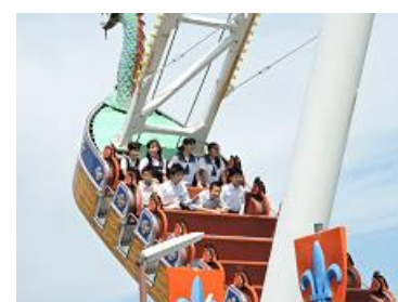
【グリーンランドを満喫】