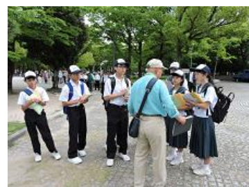
【ボランティアガイドさんの話を聞く】

旅行中の2年生の身なりや態度がとてもよかったです。旅行先で一緒になった他校の先生も、とても感心していらっしゃいました。うれしいことですね。