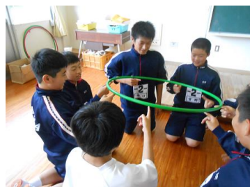
【イニシアチブゲームでは協力し合って】