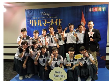
【リトルマーメイド観劇記念】