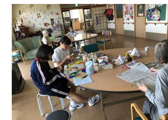
【「グループホーム明和の家」にて】