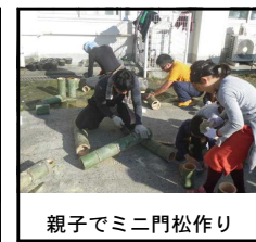
親子でミニ門松作り