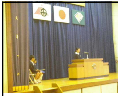
始業式児童代表の言葉

平成最後の元旦は、まぶしく輝く初日の出を雲間から拝むことができ、思わず今年が良い年でありますようにと願うことでした。