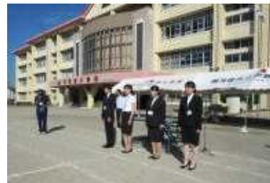
9月18日(火)から20日(木)まで、鹿大の1年生が研修にきました。