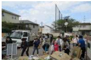
9月15日(土)に資源回収を実施しました。ご協力ありがとうございました。