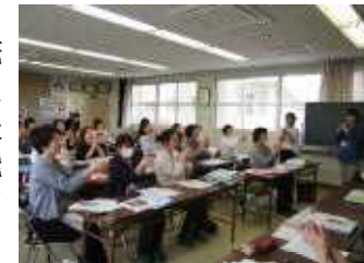
<ミーティングの様子>

本校では，毎週水曜日の朝読書の時間に，「ボランティアグループいちょう」のみなさんが子どもたちに読み聞かせをしてくださっています。集中してお話を聞くことで，子どもたちも落ち着いた気持ちで授業に臨むことができます。本を読んでもくださる方が増えると，より多くの学級での読み聞かせが可能になります。希望してくださる方は，学校までご連絡ください。