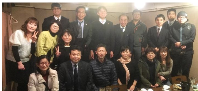
【四校PTA連絡会集合写真】

1月12日(土)18時より、本年度2回目となる伊敷台中学校区四校PTA連絡会を、「蔵ぼうず」にて実施いたしました。出席者は、伊敷小・花野小・伊敷台小・本校PTAから、それぞれPTA会長他執行部、校長、教頭で合計17人が顔を合わせる会議となりました。前半は、各校のPTA会長の挨拶や出席者の紹介、次年度へ向けての四校PTAの活動の在り方などについて、真剣な協議を行いました。話し合いの結果、次年度は何らかの形で中学生と小学生が交流できるようなイベントを企画しよう、ということになりました。詳しい内容、方法等は次年度へ引き継ぐこととなりましたが、担当や役員があまり無理をしない方法を、各単位PTAで考えておくこととなりました。後半は懇親会を行い、四校のPTA執行部の絆を強めていくことを確認しながら、楽しいひとときを過ごすことができました。