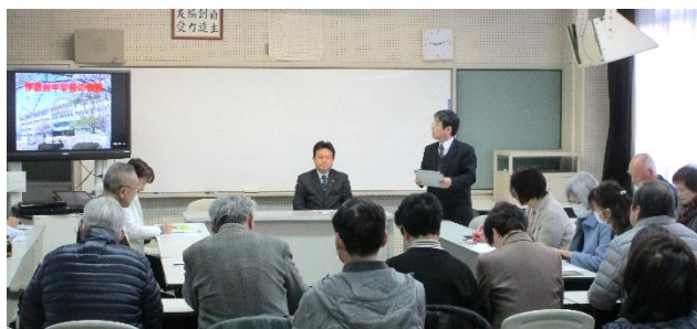
【本校の教育活動説明の様子】

地域の皆様からの声は大変ありがたく、生徒の健全育成に是非、役立てていきたいと考えております。今後共、地域での生徒の情報がございましたら、どしどしお寄せいただきますようよろしくお願い申し上げます。